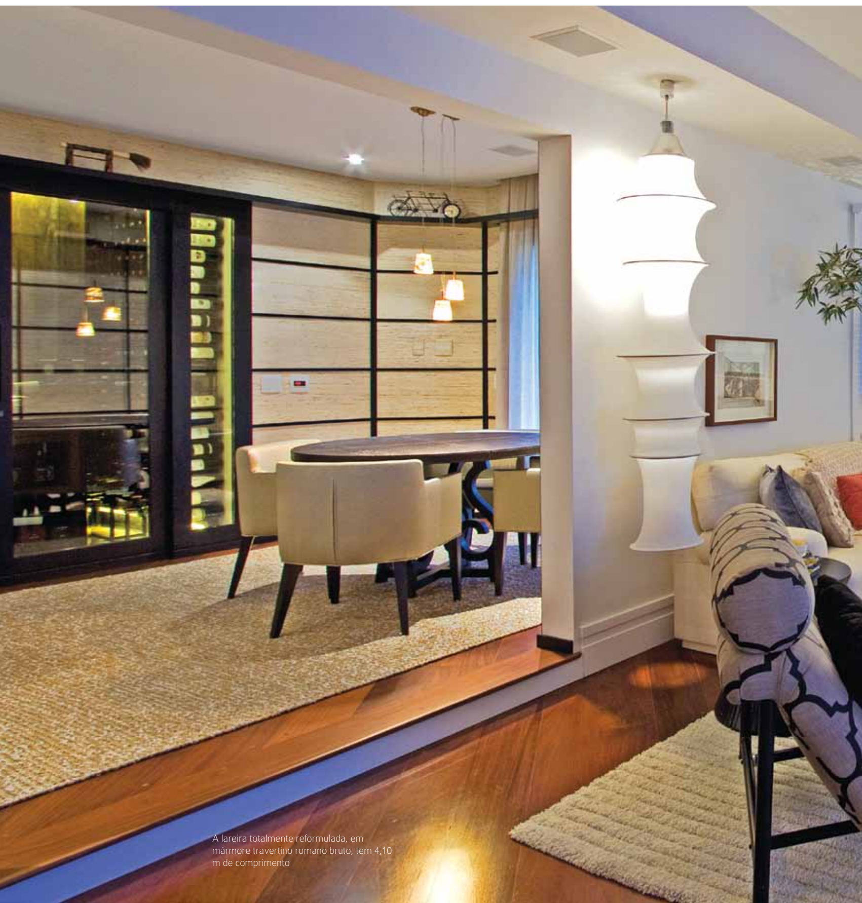
A lareira totalmente reformulada, em mármore travertino romano bruto, tem 4,10 m de comprimento