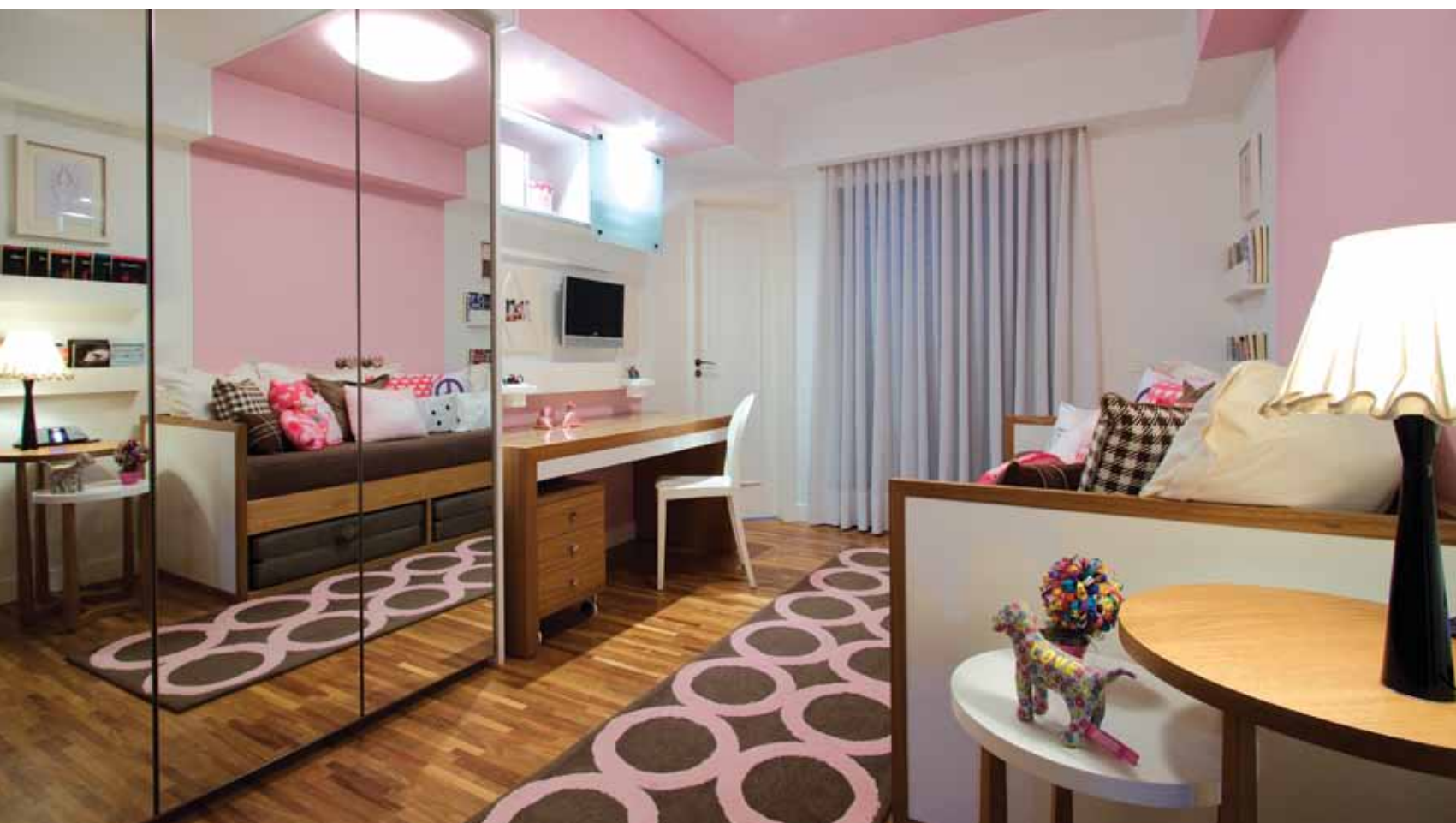
O papel de parede contorna duas paredes e ganha o teto no quarto da filha do casal