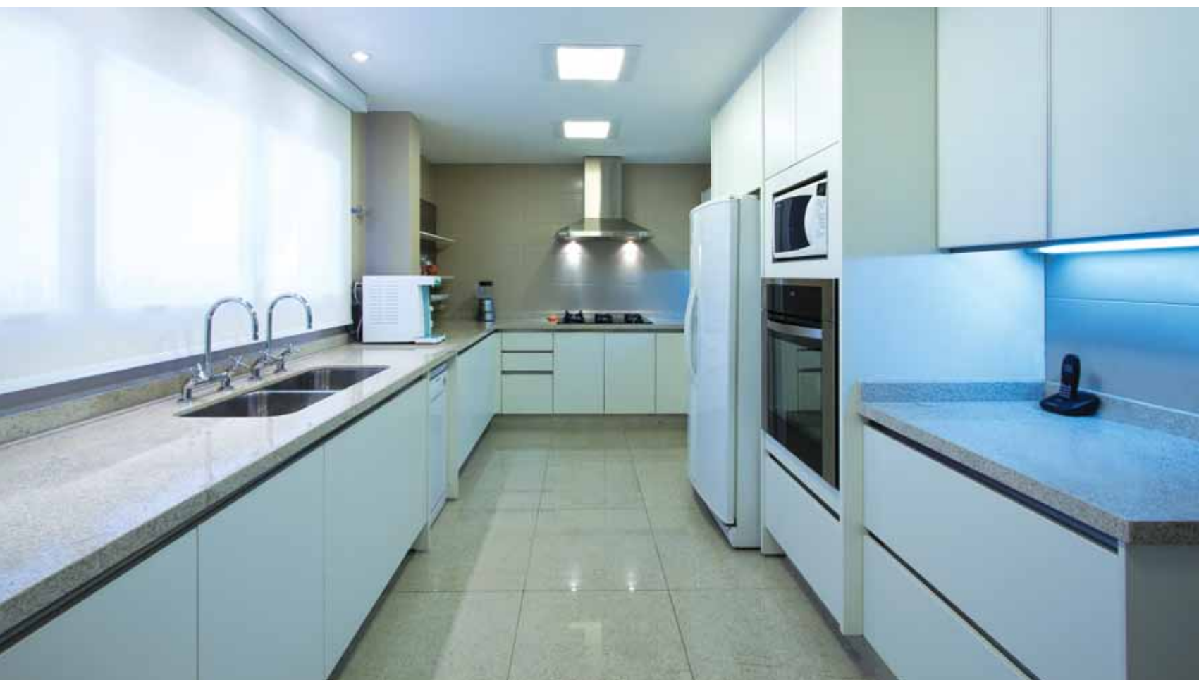
Prática, moderna e clean . A cozinha é inteiramente azulejada a pedido da moradora e ganhou mais espaço com a incorporação da despensa